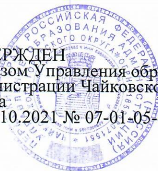
График проведения проверок организации питания обучающихся 1-4 классов муниципальных общеобразовательных учреждений, подведомственных Управлению образования администрации Чайковского городского округа

УТВЕРЖДЕН приказом Управления образования администрации Чайковского городского округа от 15.10.2021 № 07-01-05-475